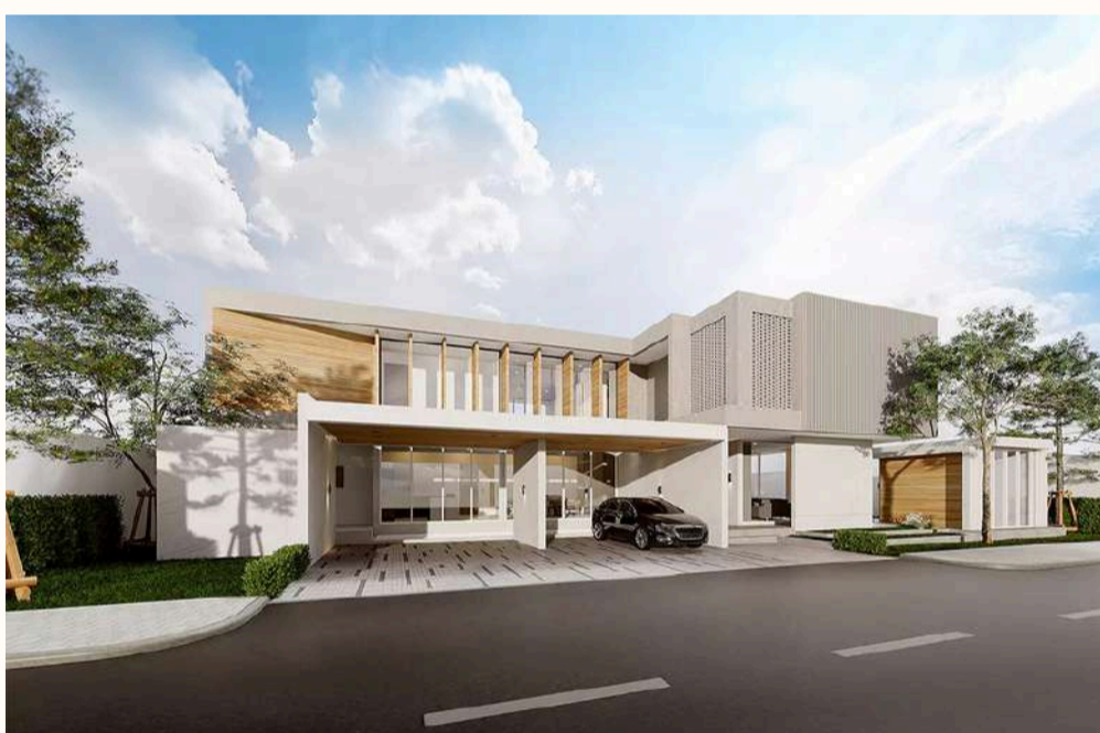
แบบบ้าน Model : RUBY