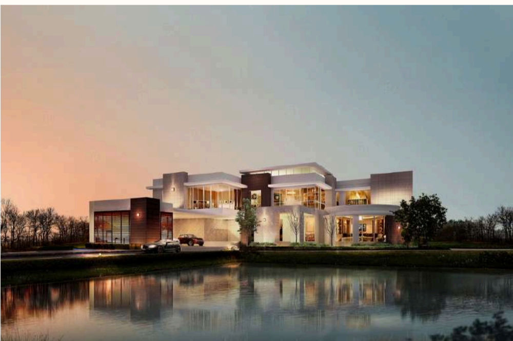
แบบบ้าน MODERN 06