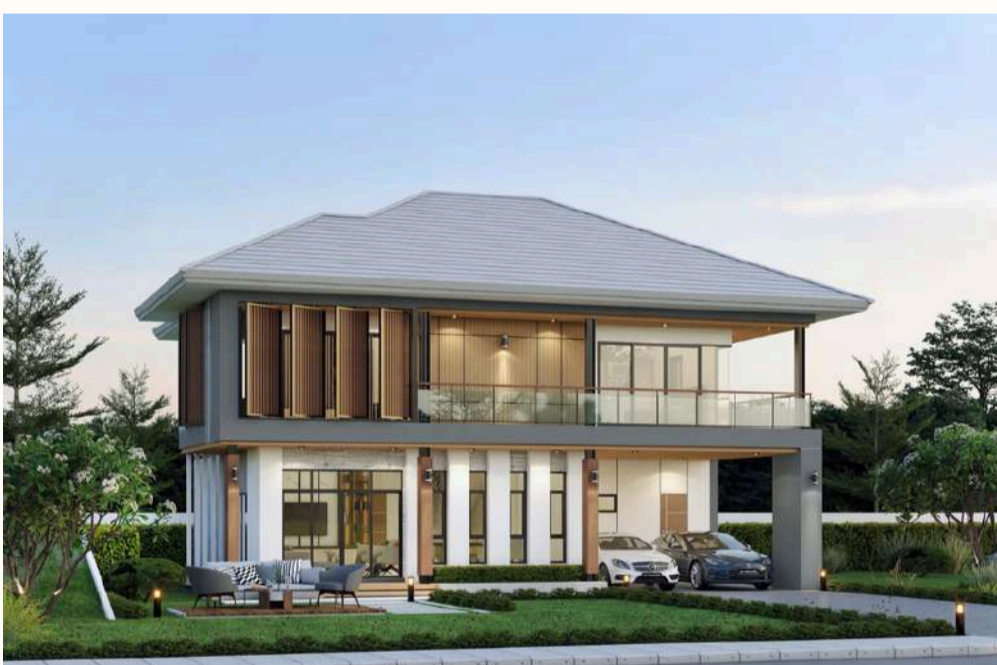
แบบบ้าน พิมุกดา