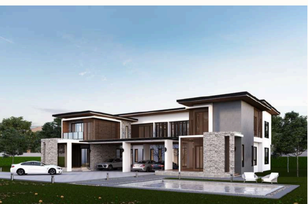
แบบบ้าน MG GRAND 3