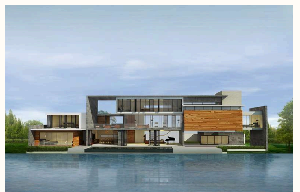
แบบบ้าน The Panorama