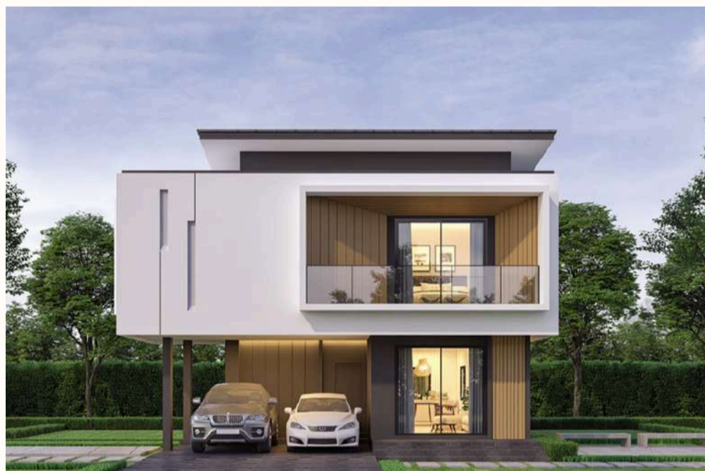
แบบบ้าน Life Box 205