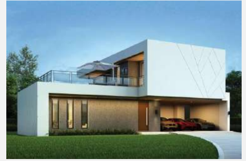
แบบบ้าน RH-MD. 2174