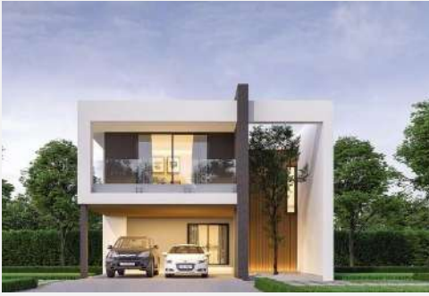
แบบบ้าน Cube 213

สไตล์โมเดิร์น เส้นโค้งความเรียบง่าย ตกแต่งน้อยแต่มากด้วยความสวยงาม