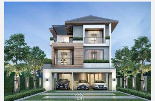
แบบบ้าน SS 302