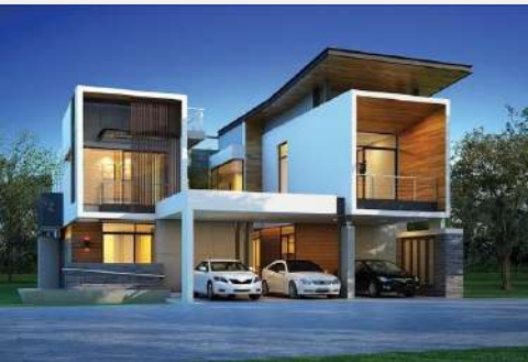
แบบบ้าน Trendy 3