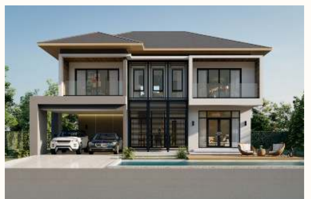
แบบบ้าน HSD – 02 Ava