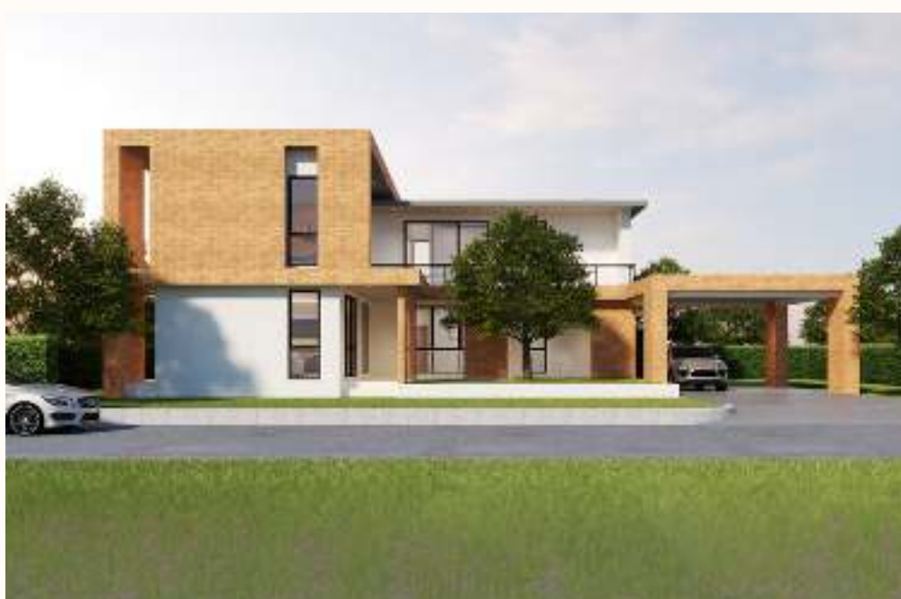
แบบบ้าน MG Grand 6