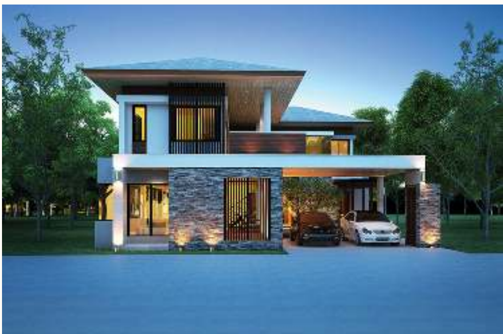
แบบบ้าน Urban 5