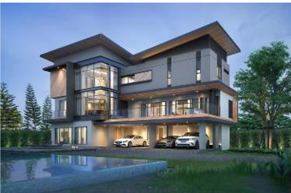
แบบบ้าน Rodina (ครอบครัว)