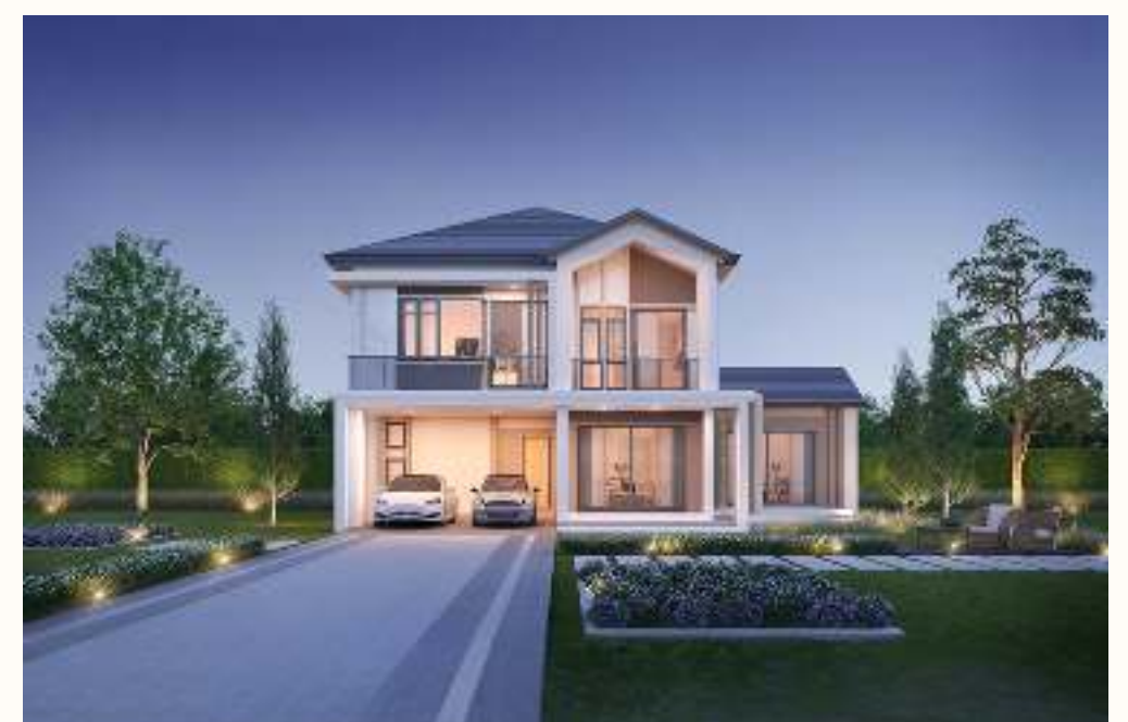
แบบบ้าน THE GRACE 315