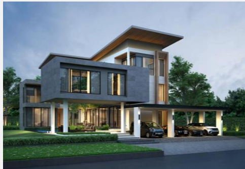
แบบบ้าน Gratiso (ครอบครัว)