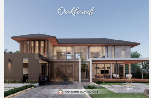
แบบบ้าน CO-12 : Oaklands