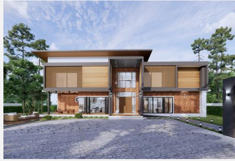
แบบบ้าน ABSOLUTE 09