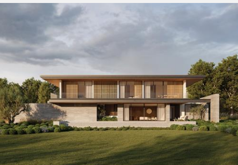
แบบบ้าน Linear House