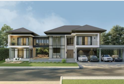
แบบบ้าน HSD - 01 The Grace