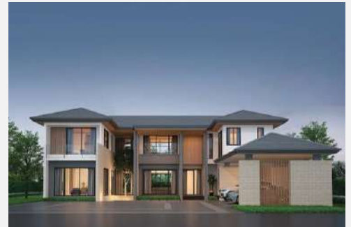
แบบบ้าน Serene 554