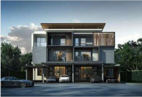
แบบบ้าน ABSOLUTE 04

10 แบบบ้านสมัยใหม่ การนำเทคโนโลยีมาช่วยในการลดการใช้พลังงานและสร้างสถานที่อยู่อาศัยที่ยั่งยืน