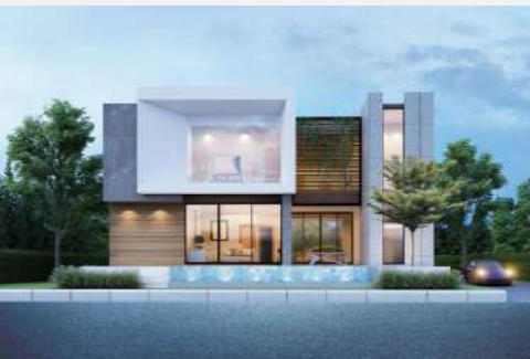
แบบบ้าน RH-MD. 2170