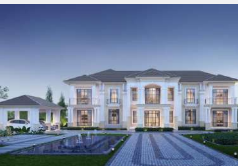
แบบบ้าน THE GRAND 918