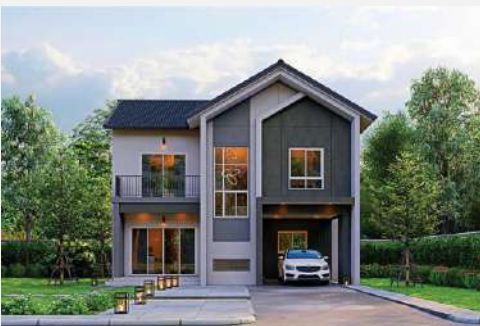
แบบบ้าน SMILE 3